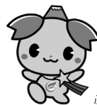
ふじみ野市PR大使「ふじみん」

ふじみ野市役所 市民生活部 市民総合相談室 〒356-8501 埼玉県ふじみ野市福岡1-1-1 TEL 049-261-2611(代表)