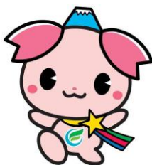
ふじみ野市 PR 大使 『ふじみん』