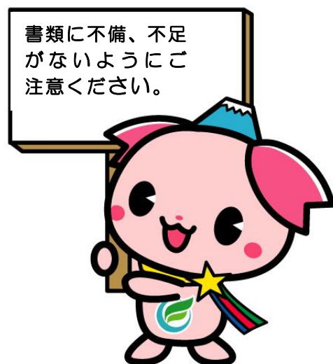
ふじみ野市PR大使『ふじみん』