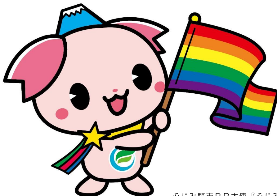
ふじみ野市PR大使『ふじみん』