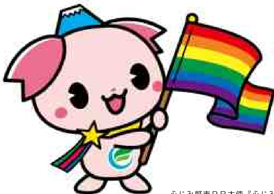
ふじみ野市PR大使『ふじみん』