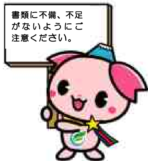
ふじみ野市PR大使『ふじみん』