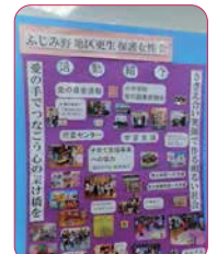
↑ふじみ野地区更生保護女性会