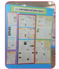
↓福岡中央公園を愛してる会