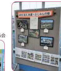
↑NPO法人 舟運・ふじみんの郷