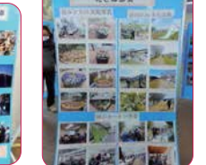
↓子ども会育成団体連絡協議会