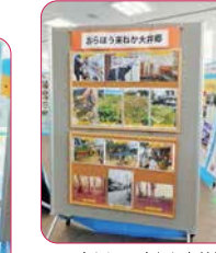
↑おらほうかねか大井郷 つながりタイズ