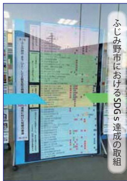
ふじみ野市におけるSDGs達成の取組

18団体が展示会に参加し、展示会期間中、150人が来場しました。ありがとうございました。