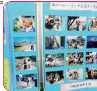
↓避難者支援活動実行委員会