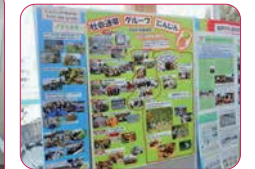
↑社会連帯グループにんじん