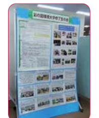
↑彩の国環境大学修了生の会