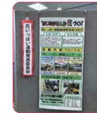
↑花いっぱい運動推進委員会