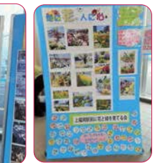
↑福岡駅前に花と緑を育てる会