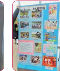
↑障がい者とともにとんぼの会