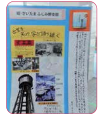
↑結・さいたま ふじみ野支部