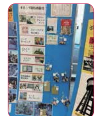
↑つきつぶ実行委員会