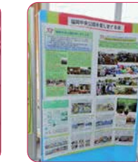
↑福岡駅前に花と緑を育てる会