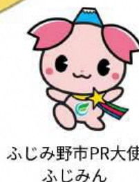
ふじみ野市PR大使 ふじみん