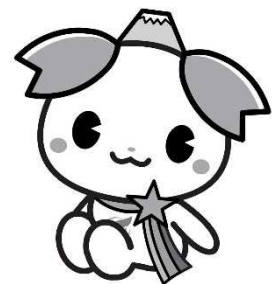
ふじみ野市PR大使 『ふじみん』