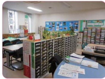
市民活動支援センター利用状況