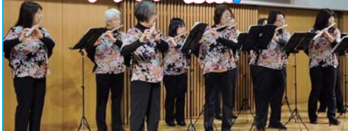
市民活動交流会 2020 の様子 [市民交流プラザ]