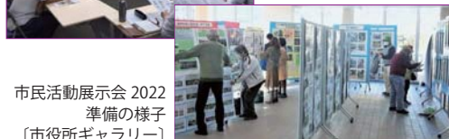
市民活動展示会 2022 準備の様子 [市役所ギャラリー]

コロナ禍が長く続き、市民活動交流会も2021年、2022年は開催することができませんでした。今年こそ！の思いで、準備を始めたいと思います。