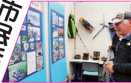
2020年2月「市民活動交流会 2020」展示ルームの様子