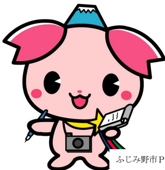
ふじみ野市PR大使『ふじみん』