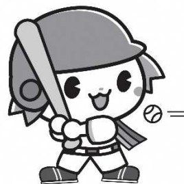
ふじみ野市 PR大使『ふじみん』