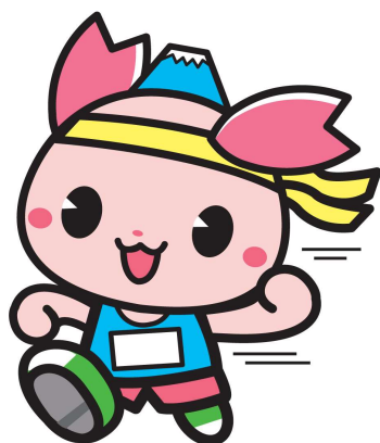
ふじみ野市PR大使『ふじみん』