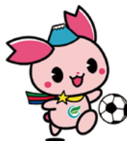
ふじみ野市PR大使 「ふじみん」