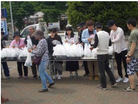
▲緑のカーテン配付状況