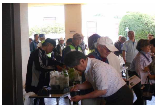
▲緑のカーテン配付状況