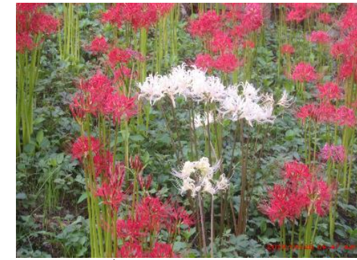
4.野草園(白い彼岸花)