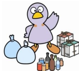
埼玉県マスコット「コパトン」

現在、県内では年間約50万トンの事業系ごみが排出されています。ごみの最終処分場の残余容量がひっ迫している中、ごみの削減は重要な課題です。限りある資源を有効に活用するためにも、以下のチェック項目を参考に、一層のごみ減量・リサイクルに取り組みましょう。