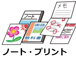
ノート・プリント