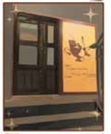
スタイリッシュな レトロ感が溢れる お店の入り口