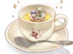
カラメルほろ苦さと 上品な甘さの カスタードが人気のプリン