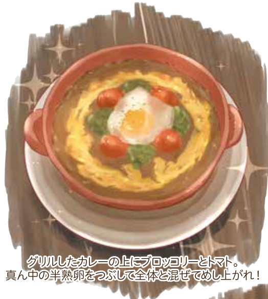
グリルしたカレーの上にプロックリーとトマト。 真ん中の半熟卵をつぶして全体と混ぜてめし上げれ！