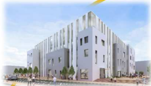
ステラ・ウェスト (西文化施設) ※図書館を複合