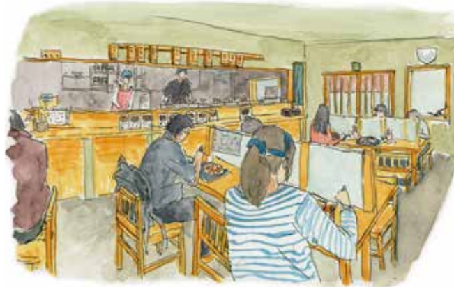
とても清潔で明るい雰囲気の店内。開店は朝7時から