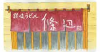
貴重! 長嶋茂雄さんが退院後に 初めて書いた文字で作ったのれん

「オールふじみ野」 未来政策会議のメン バーが「ふじみ野市の 魅力の発信」について、 今月号から12回にわた って、「ふじみんの いいところ探し」として、 市報の裏表紙に連載し ます。市内のお店など の注目情報を紹介して いきますので、お楽し みください。