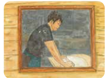
玄関脇のガラス窓から、ご主人が うどんを打つ様子が見られる