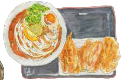
一番人気のかけうどんと天ぷら。 生姜、天かす、ゴマはサービス!