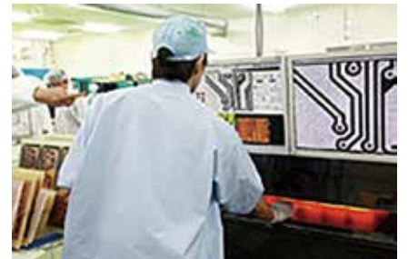
製造工程 中間検査