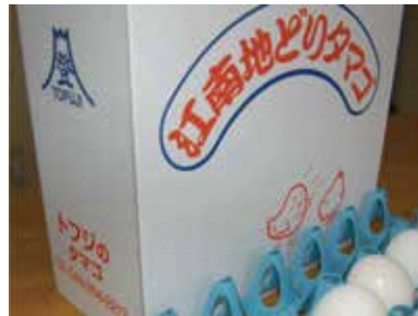
バラエティセット用ケース ご要望により個数や種類を調整します。

白身と黄身が分離している状態で少量から納品 機械で割卵すると黄身と白身が混ざってしまう