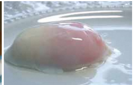
温泉卵もごさいます