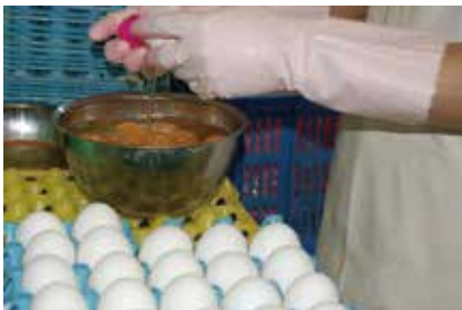
手割りによる割卵