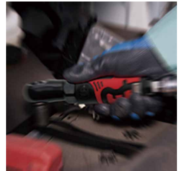
製品例:ラチェットレンチ