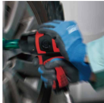
製品例:インパクトレンチ