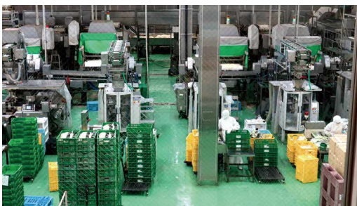
ふじみ野工場の様子