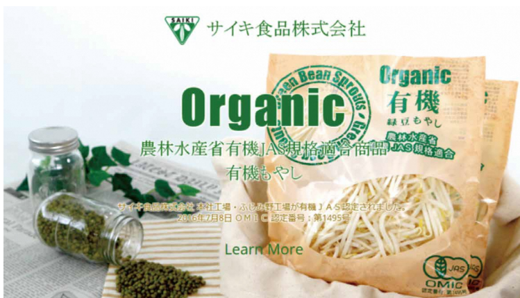
JAS認定の有機緑豆もやし