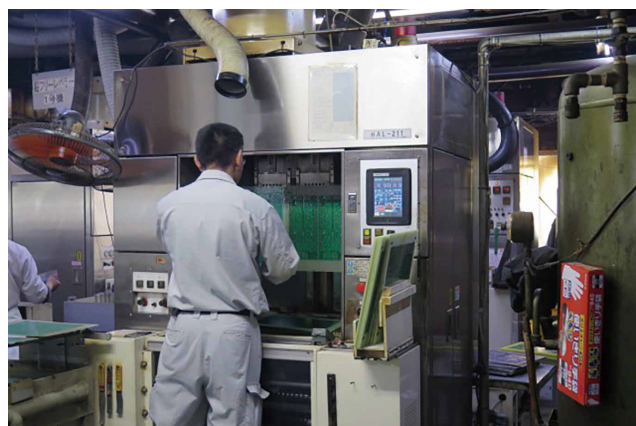
半田レベラー作業