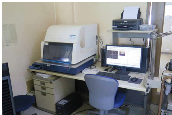
蛍光X線装置による評価分析