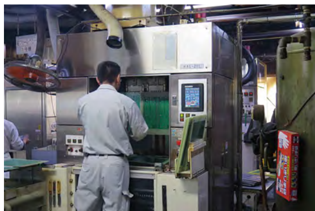
半田レベラー作業