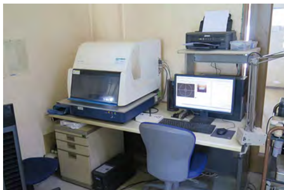
蛍光X線装置による評価分析