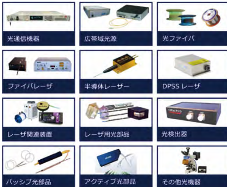
ファイバーラボのカテゴリ別製品