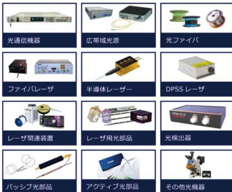
ファイバーラボのカテゴリ別製品