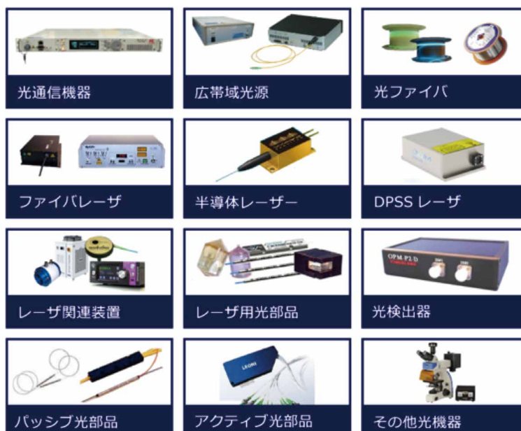
ファイバーラボのカテゴリ別製品