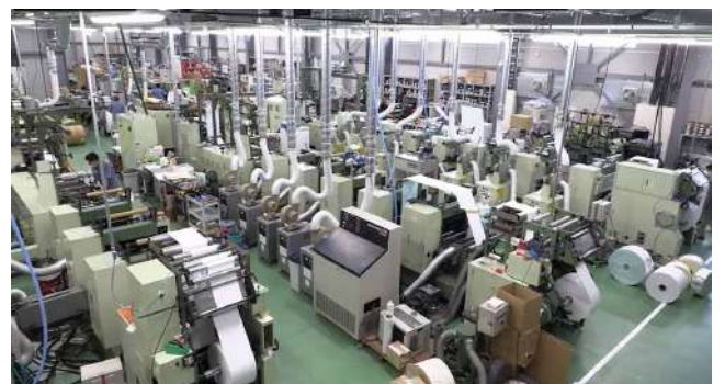
本社工場内の様子

主力の宛名ラベルシール 1ラベル毎剥がしやすいように型抜き（ハーフカット）してプリンターで重送をしない様に型跡を残さない技術が難しい。