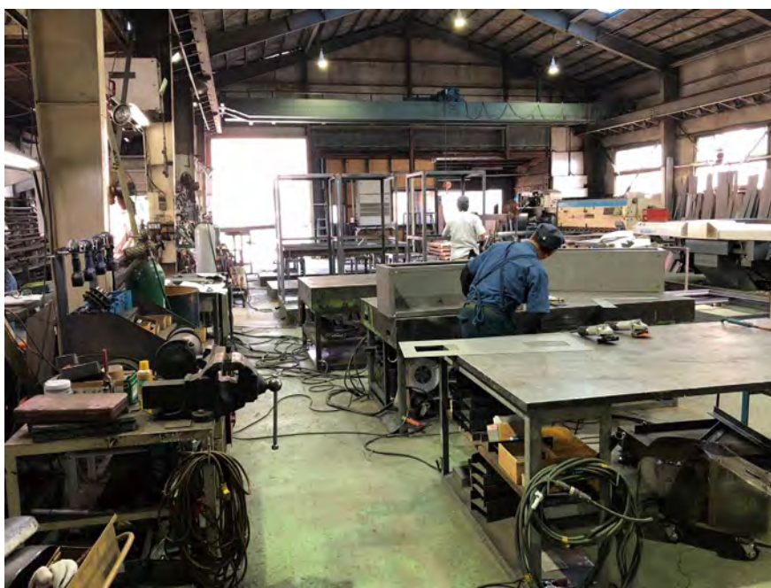
工場内の板金加工の様子