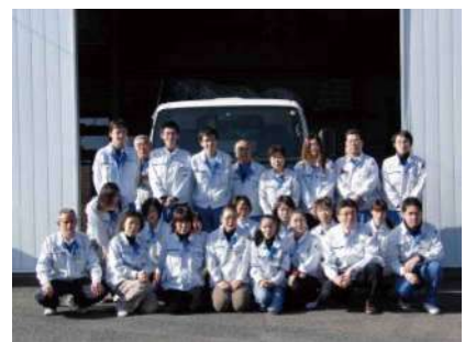
若い世代が活躍する元気で明るい職場です