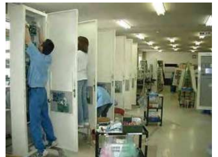
部品の組み込み作業