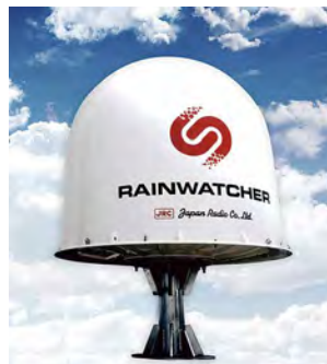
Xバンド小型気象レーダー