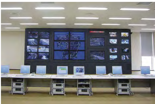
道路情報管理システム