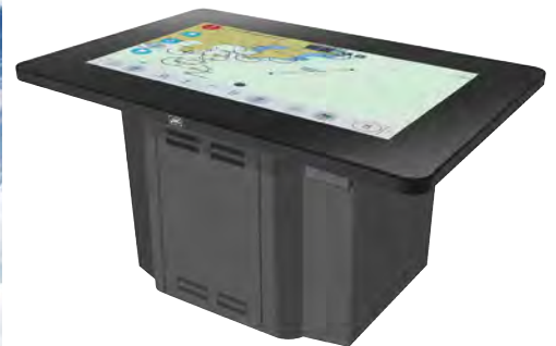
運行支援装置 J-Marin NeCST