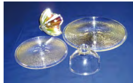
舞台照明用フレネルレンズ、航空機の着陸誘導灯等

永年培ってきたガラス加工技術をもって、医療用撮像管、X線管など、お客様の求める高度な技術・品質水準の製品を供給