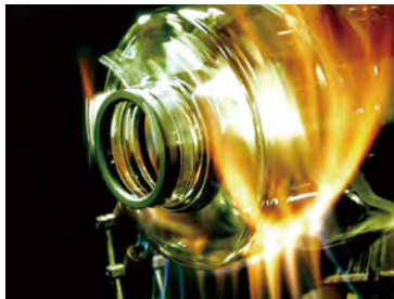
医療用ガラス器具の成形工程