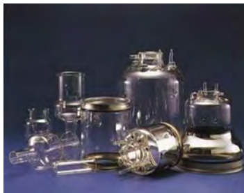
各種電子管用ガラスバルブ