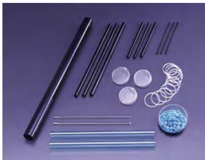
微細な工業用ガラス製品