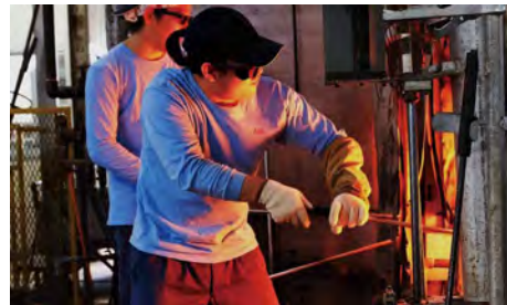
手吹き職人による作業