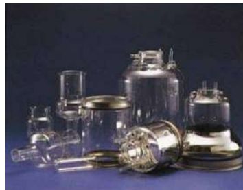
各種電子管用ガラスバルブ