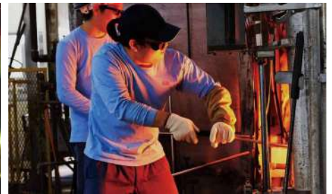
手吹き職人による作業