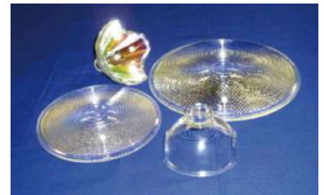
舞台照明用フレネルレンズ、航空機の着陸誘導灯等

永年培ってきたガラス加工技術をもって、医療用撮像管、X線管など、お客様の求める高度な技術・品質水準の製品を供給