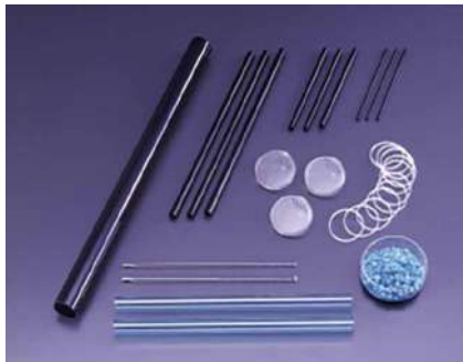
微細な工業用ガラス製品