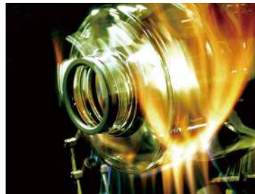
医療用ガラス器具の成形工程