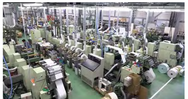
本社工場内の様子

主力の宛名ラベルシール 1ラベル毎剥がしやすいように型抜き（ハーフカット）してプリンターで重送をしない様に型跡を残さない技術が難しい。