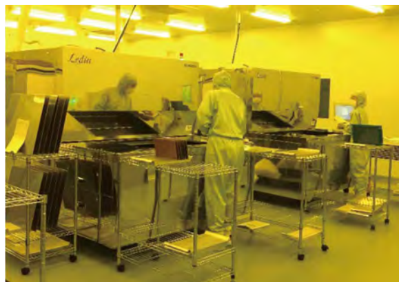
基板のパターンニング工程の様子(配線の焼付作業)