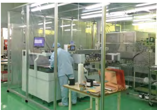
基板のレジスト工程の様子(板の色付作業)