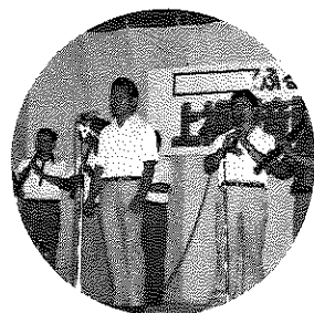
自慢のノドを聞いてください