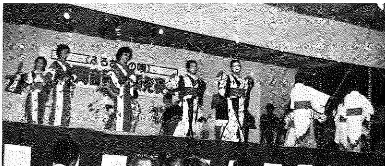
「ハア〜ヨイトセ花のヨ〜」はなやかに上福岡音頭・小唄の発表会