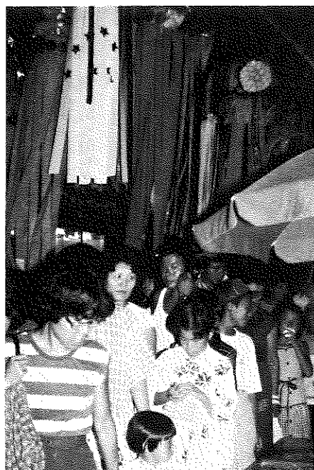
竹かざりのトンネルの中は大にぎわい