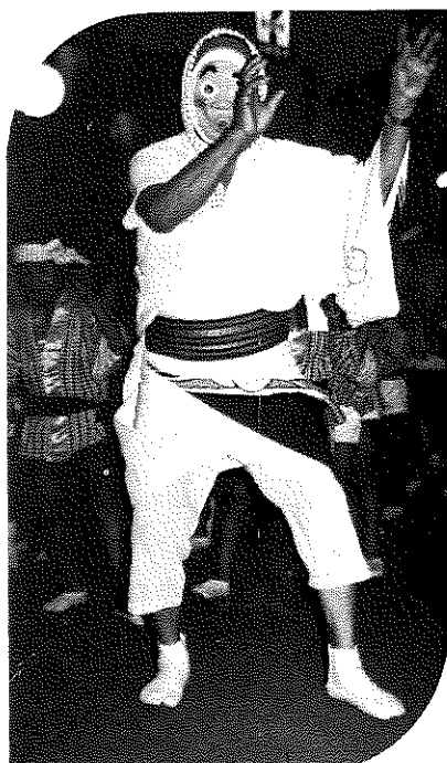
軽快なリズムに乗っておとなも子供も阿波おどりでファイバー