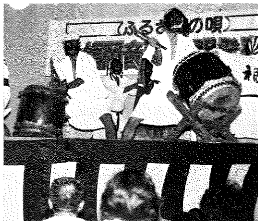
バチさばきもあざやかに太鼓を披露