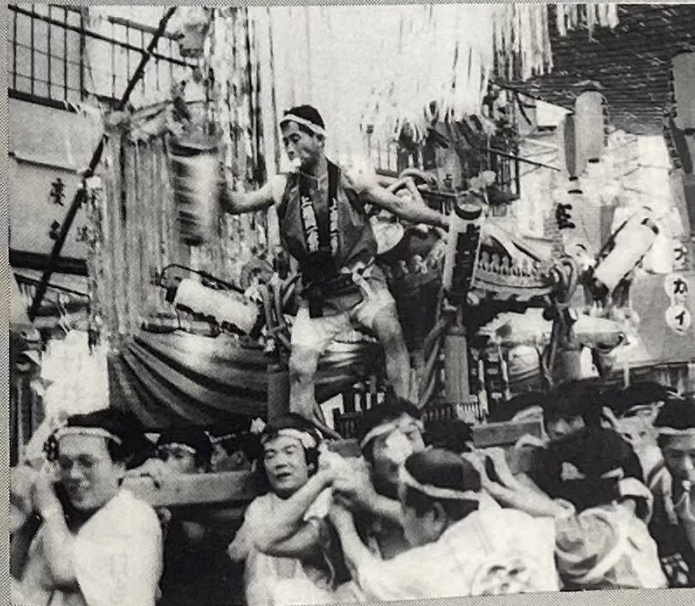
セイヤンセイヤン かけ声も勇ましく大みこしが商店街をねり歩く

上福岡の夏の風物詩「七夕まつり」が8月6・7日に、市内各商店街や中央公園などで行われました。色とりどり、華やかな竹かざりのトンネルと露店がびっしり並んだ商店街は、平日というのに昨年を上回る約10万人の見物客でにぎわいました。今年30回を記念して内容も盛りだくさんで、6日は、大みこしの競演、七夏の女王コンテスト、踊りと歌のパラエティーショーなどが行われ、7日は、上福岡音頭総流し、阿波おどりなどが行われました。2日間、市民が繰り広げた七夕まつりの模様を再現してみます。