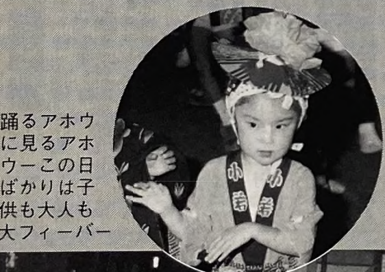
踊るアホウに見るアホウーこの日ばかりは子供も大人も大フィーバー

★七夕まつりのビデオテープを無料貸し出し 七夕まつりの模様を収録したビデオテープ(30分)を九月十七日から貸し出しします。申し込みは、広報広聴課(☎2611内線255)まで。