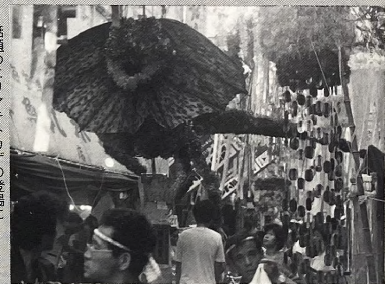
話題のエリマキトカゲの登場に子供たちは大喜び