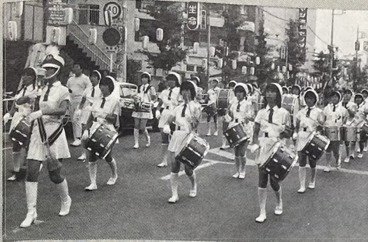
文京学園鼓隊のオープニングパレードで七夕まつりの幕あけ