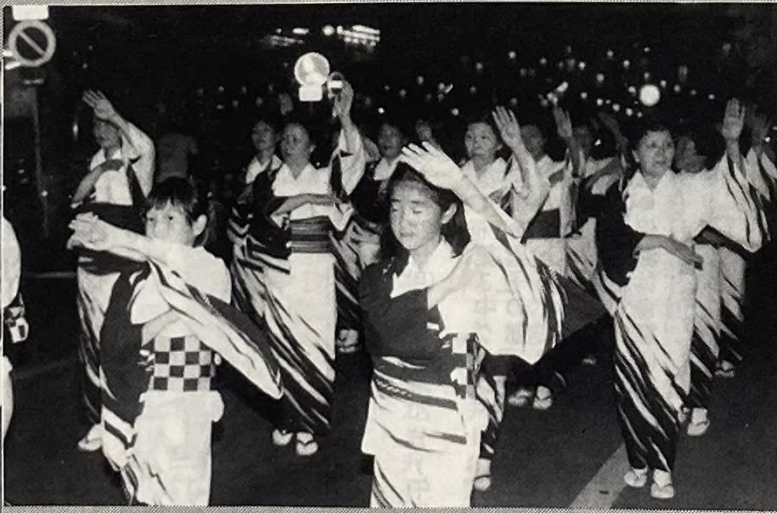
上福岡音頭市民総流しには300人の市民が参加しまつりは最高潮に