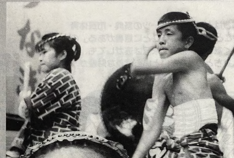
福岡太鼓会の子供たちも見事なパチさばきを披露