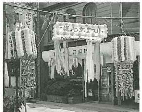
商工会連合会長賞