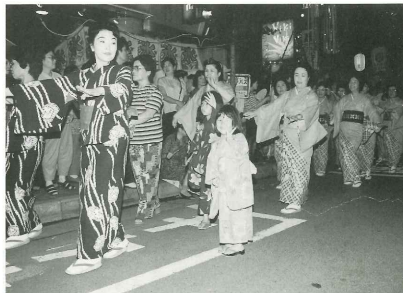
「右」入間東部地区消防本部音楽隊のオープニングパレードで七夕まつりの幕開く 「上」「あれも、これもほしい」露店は子どもたちに大人気 「下」子どもも交って市民踊りの大きな輪が