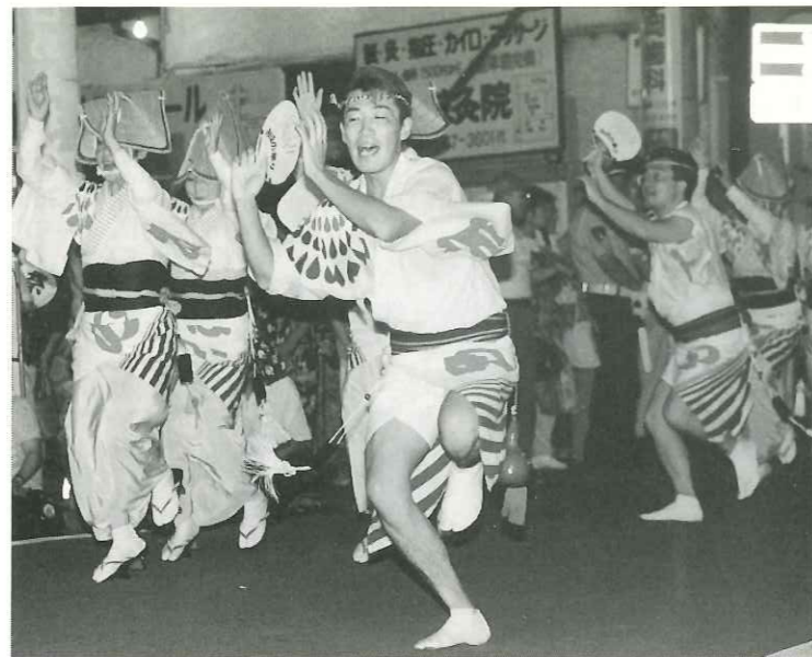
七夕まつりには欠かせなくなった阿波踊り大会