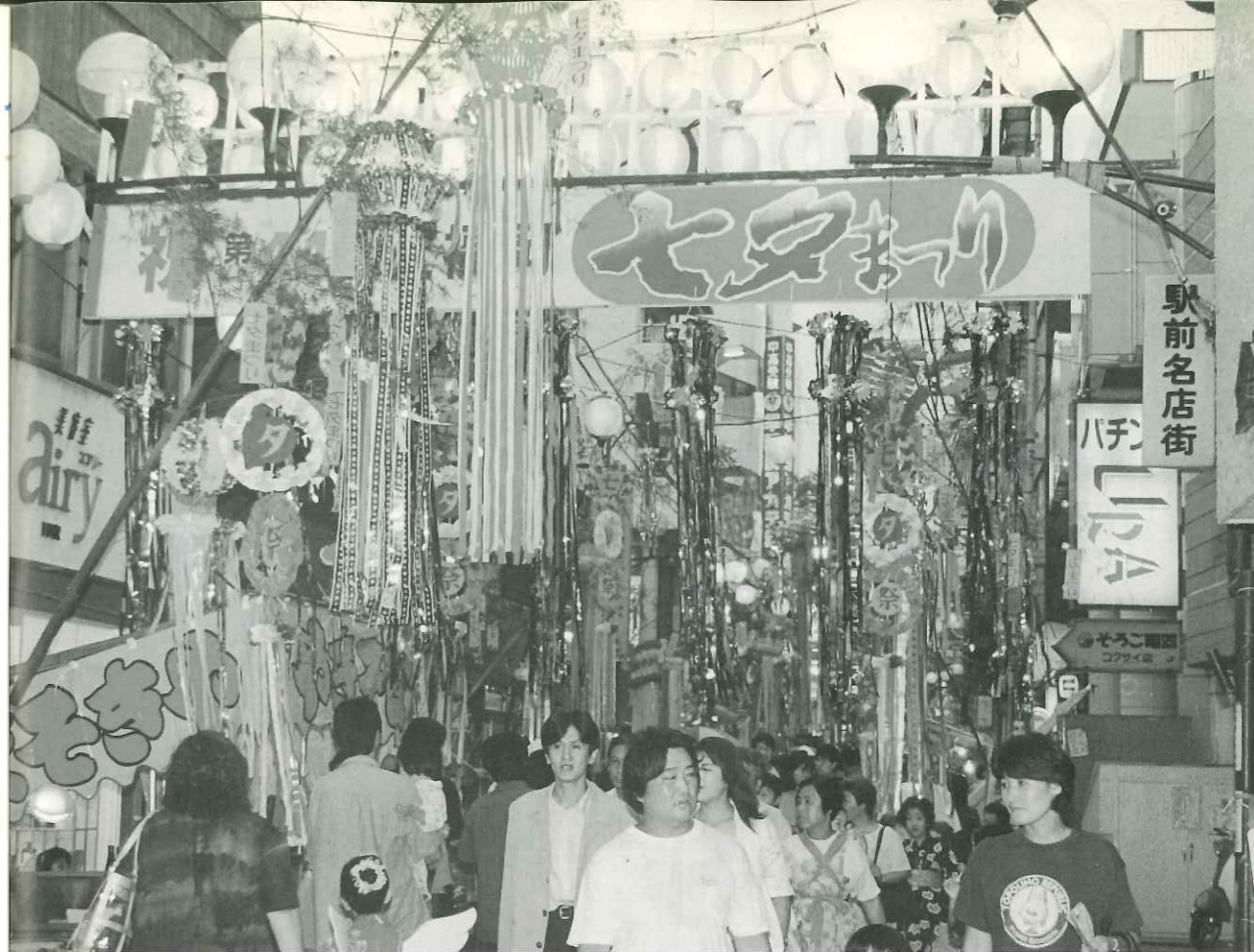
商店街にできた竹飾りのトンネルの中を歩いて七夕の風情を満喫