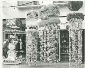
商店会連合会長賞