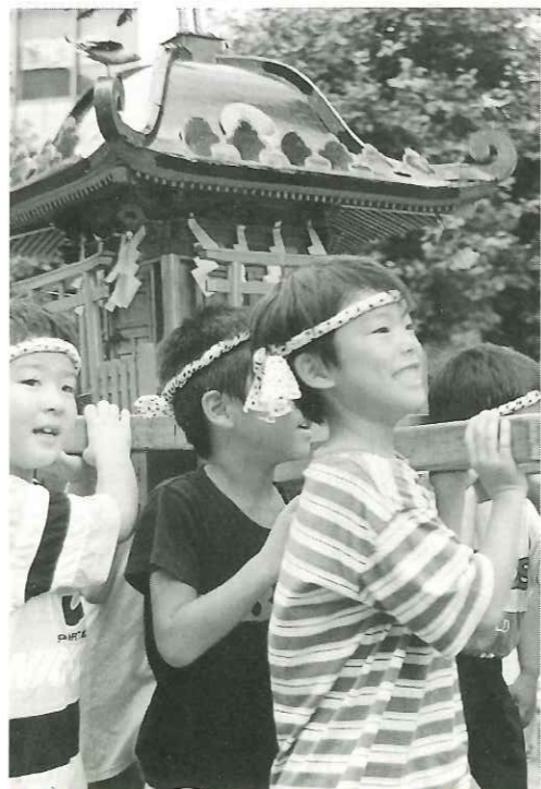
「上」「ワッショイ! ワッショイ!」声高らかに子どもミコシがねり歩く 「左」勇壮な太鼓の響きに引き寄せられて人垣が