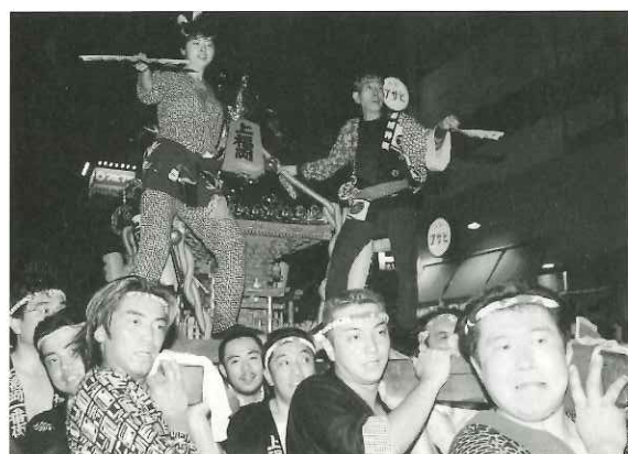
[左] 2年ぶりに商店街をねり歩くみこし [右] 本部会場の上福岡ウルトラクイズで上福岡度をチェック [下] サンロードの夜空に舞う富士見地区とび職組合のはしご乗り