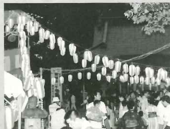
鎮守の森の盆踊り(滝自治会)

ことしの夏、市内の自治会や町内会では地域の連帯とコミュニティづくりのため、地域の特徴を生かした夏まつりが開かれ、各会場では子どもから高齢者までの笑顔で、夏の楽しい思い出の1ページが飾られた。