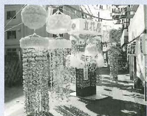
商店会連合会長賞