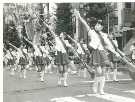
県警音楽隊のカラーガード隊を先頭にしたオープニングパレードで七夕まつりがスタート

8月7日・8日は、上福岡市の夏の彩る一大イベント「上福岡七夕まつり」。ことしで45回を数える夏の風物詩は、七夕まつりの主役である竹飾りが駅周辺の商店街だけでなく、市内各地に立ち並び、まち全体がまつり一色に染められた。県警音楽隊のパレードで始まったまつりは15万人が繰り出し、色とりどりの趣向をこらしてアーケードのようになった竹飾りの下は、ゆかた姿の子どもや家族づれなど多くの人たちでにぎわった。