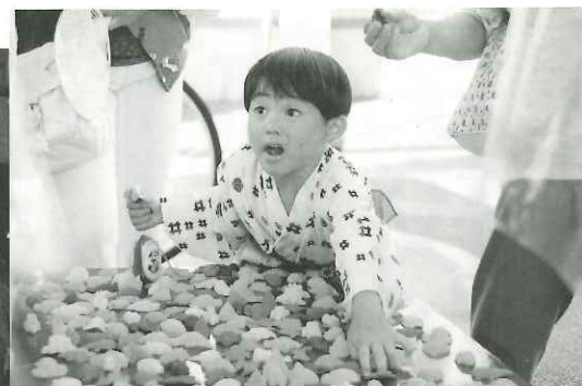
▲子どもの楽しみは何といても出店