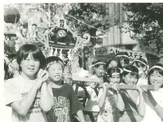
「ワッショイ、ワッショイ」と元気いっぱい子どもみこしがねり歩く

8月7日・8日は、上福岡市の夏の彩る一大イベント「上福岡七夕まつり」。ことしで45回を数える夏の風物詩は、七夕まつりの主役である竹飾りが駅周辺の商店街だけでなく、市内各地に立ち並び、まち全体がまつり一色に染められた。県警音楽隊のパレードで始まったまつりは15万人が繰り出し、色とりどりの趣向をこらしてアーケードのようになった竹飾りの下は、ゆかた姿の子どもや家族づれなど多くの人たちでにぎわった。