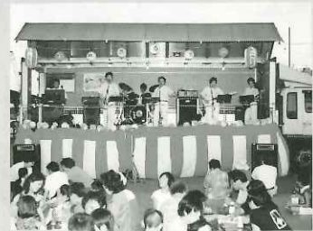
サマーコンサート(駒林西自治会)