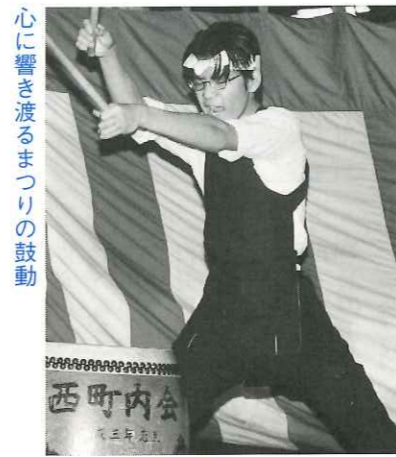
心に響き渡るまつりの鼓動