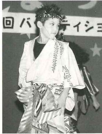
子どもとは思えないプロもびっくりの演技