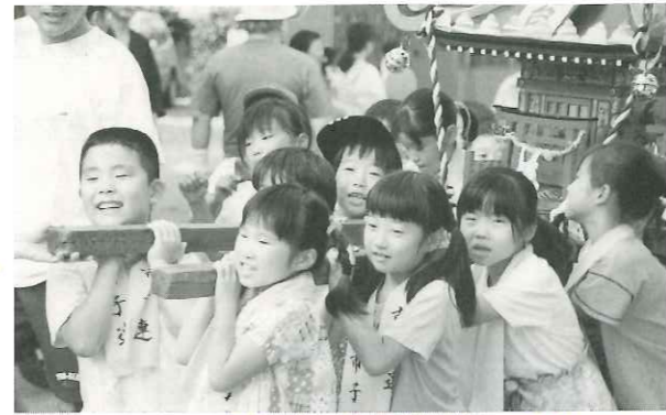
「ワッショイ! ワッショイ!」と元気な声がまつりを盛り上げる子どもみこし