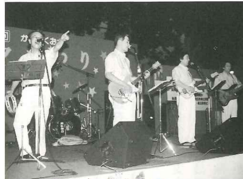
懐かしいグループサウンズの熱唱