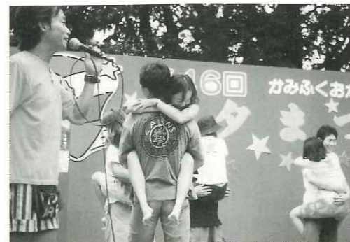
男の実力が試された(?)ダッココンテスト