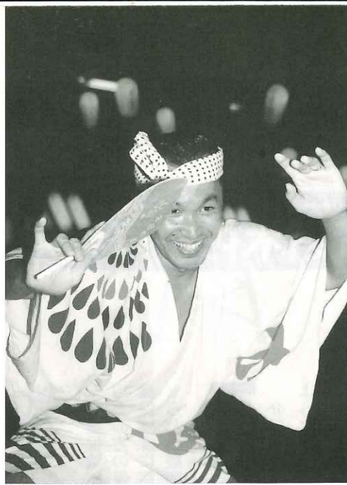
観客たちを魅了した見事な阿波踊り