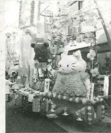
商店会連合会長賞

団体の部は1位に「上福岡銀座商店会」、2位に「上野台銀座商店会」、3位には「中央通り商店会」が選ばれました。