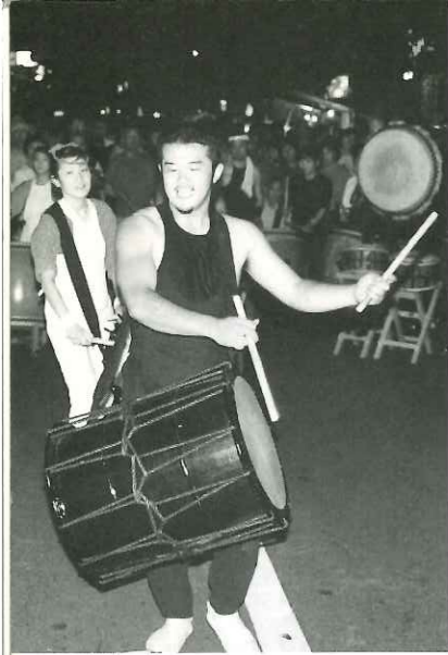
太鼓ショー(サンロード)