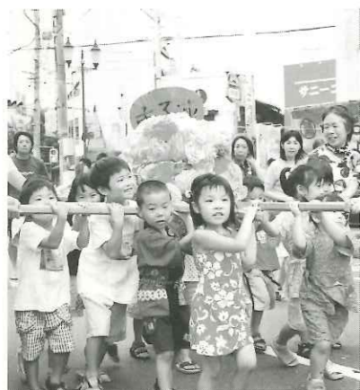
子どもみこし(サンロード)