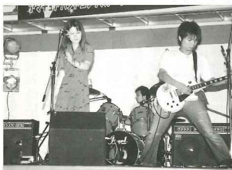
たなバトル2002(公営駐車場)