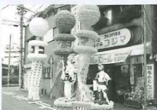
商店会連合会长賞