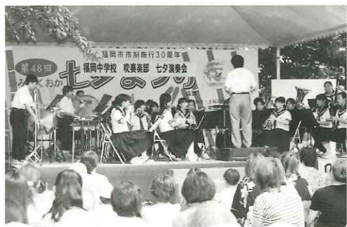
福岡中学校吹奏楽部「七夕演奏会」(本部会場)