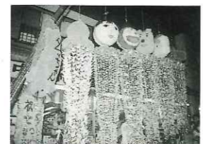
商店会連合会长賞