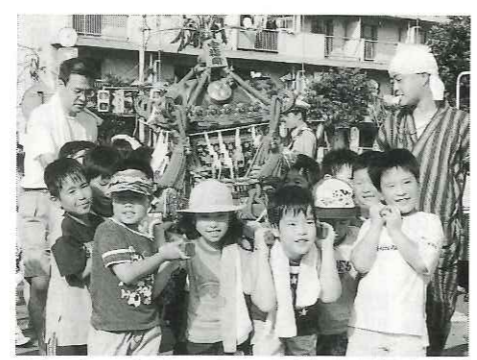
「ワッショイ!ワッショイ!」と元気な声が まつりを盛り上げる子どもみこし