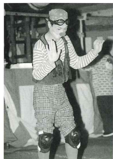
バルーンアートやマジックなどの芸で会場を 笑いのうずにしたピエロシヨ