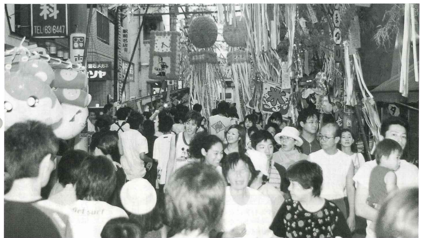
商店街にできた竹飾りのトンネルの中を歩いて七夕の風情を満喫