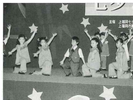
自慢の芸で魅せた市民芸能大会