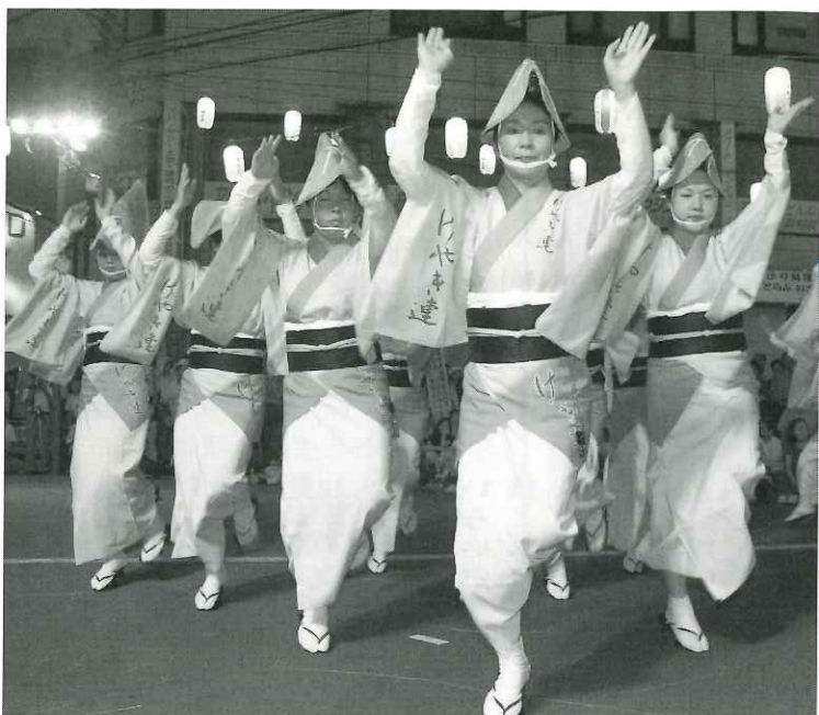
観客を魅了した見事な阿波踊り