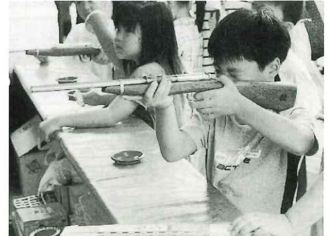
みんな真剣そのもの、射的場