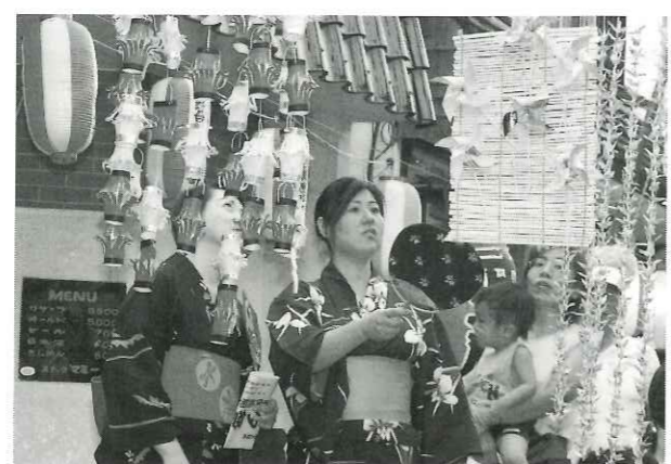
涼やかなゆかた姿で手づくりの七夕飾りに見入る