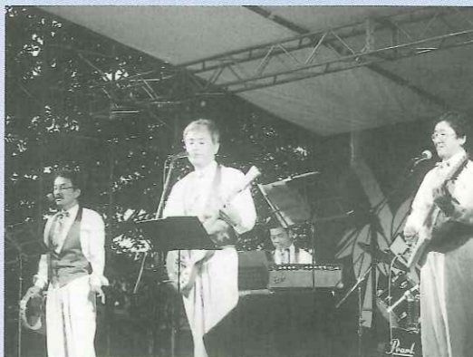
70年代のグループ・ブサウソンドの曲を演奏して中高年を魅了