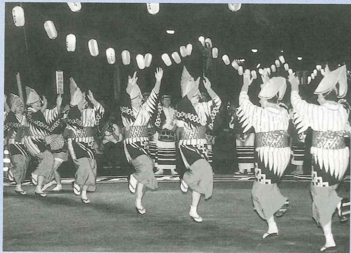
西口のイベントの顔「阿波踊り」は こしも熱気ムンムン