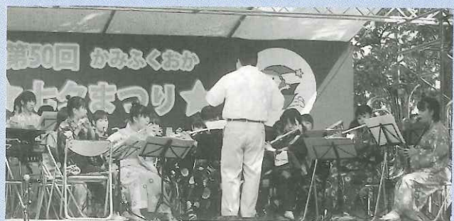
花の木中学吹奏楽部 音でまつりを彩った花の木中学吹奏楽部