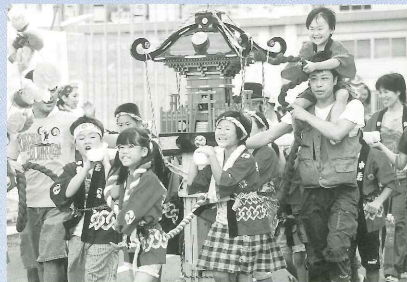
大きな声で「ワッショイ、ワッショイ」。とびっきり元気な子どもみこし