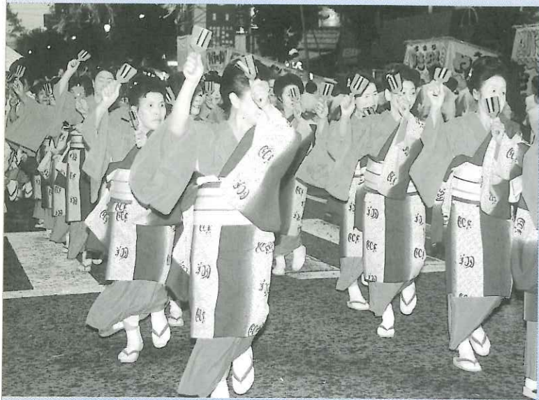
上福岡七夕まつりにも、いよいよ登場「よさこい鳴子踊り」