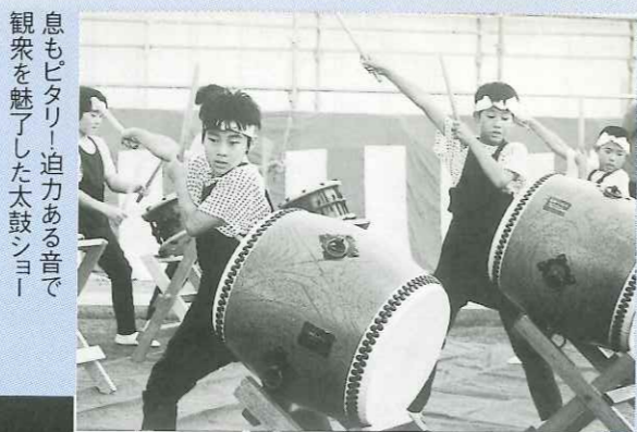
息もヒタリ、迫力ある音で 観衆を魅了した太鼓ショー