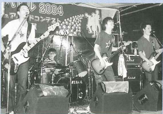
雨の中でも熱気あふれたアマチュアバンドコンテスト