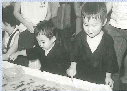
二人仲よく金魚すくい

8月7・8日、夏のフィナーレを飾る「上福岡七夕まつり」が開かれた。初日は、雨に見舞われ中止になったイベントもあったが、2日目は快晴で、絶好の七夕日和になった。2日間で16万5千人もの人びとが見物に訪れ、色とりどりに彩られた竹飾りや催しを見ながら、夏の風物詩を楽しんでいた。