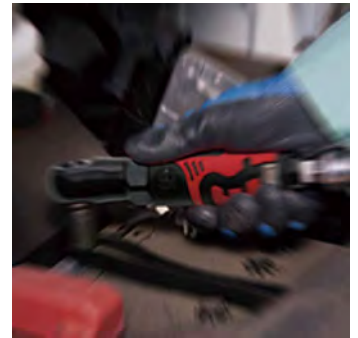
製品例:ラチェットレンチ