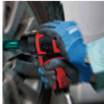
製品例:インパクトレンチ