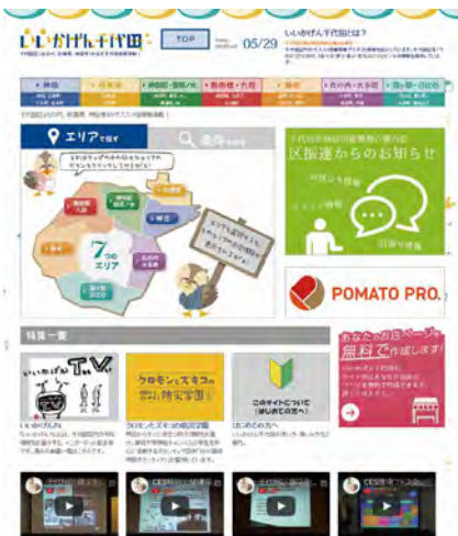
地域活性化事業口公式サイト運営 千代田区商店街振興組合連合会 「いいかげん千代田」